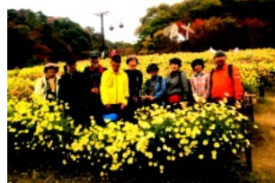
大阪ウォーキング協の皆さん