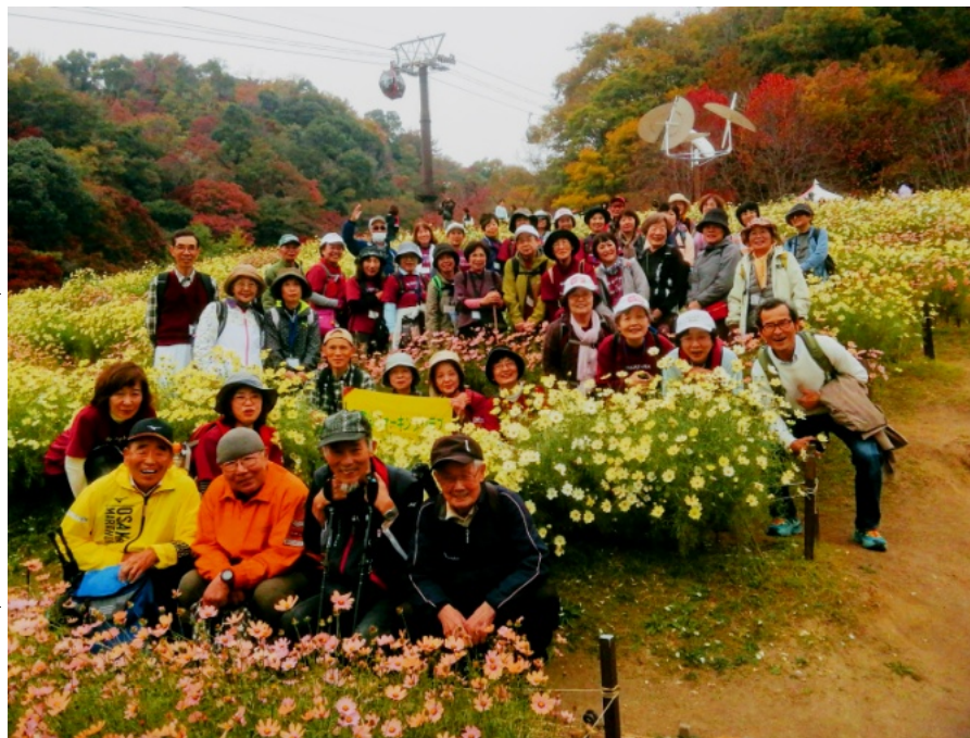
風の丘中間駅にて「コスモス畑に包まれて」

新日本スポーツ連盟兵庫〒652-080 4神戸市兵庫区塚本通7-2-17-201 TEL078-575-4885、 http://www.sports-hyogo.com