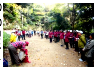
布引公園で開会式

10:00 集合 地下鉄 「新神戸駅」大阪9名 バス停前へ引率 新幹線 「新神戸駅」バス停前 にて全員集合